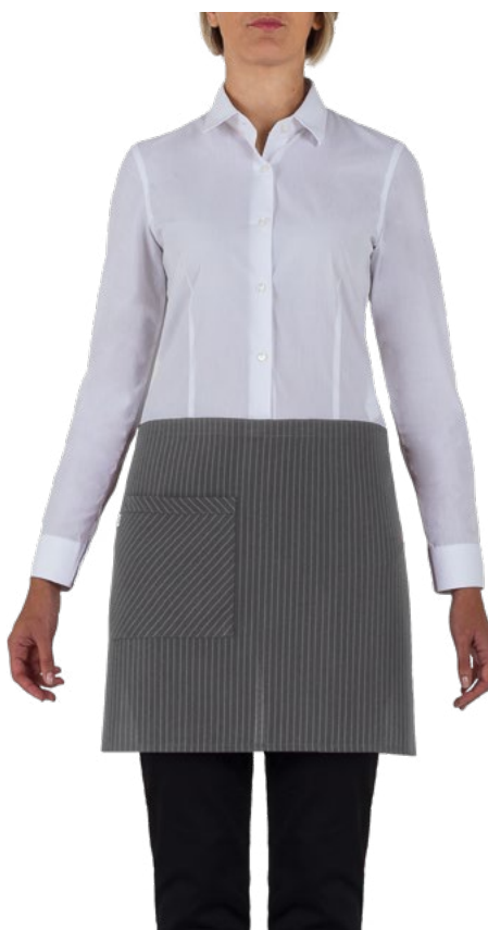
G119 Gessato grigio