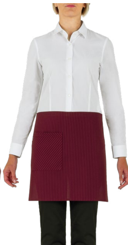
G006 Burgundy pinstripe