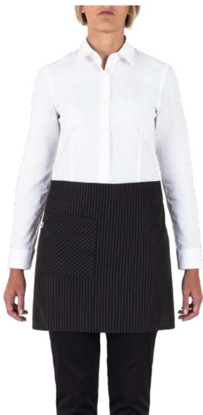
G000 Gessato nero